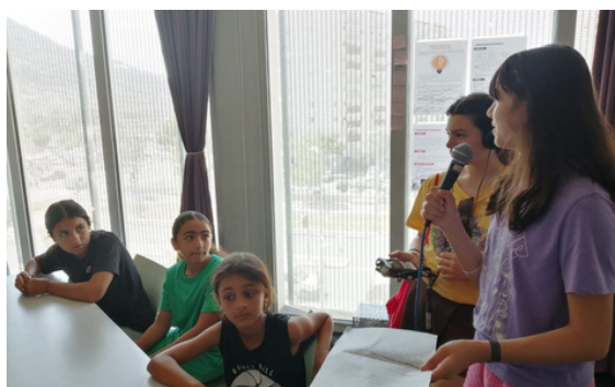
Le pôle média en pleine action