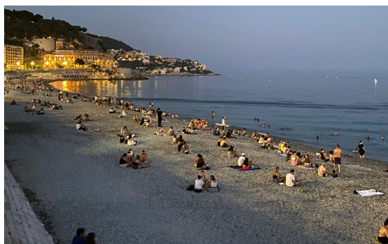
Parce qu'elle nous fait rêver... la promenade des anglais