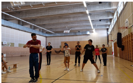
Premiers échauffements pour l'Extrem Breakdance