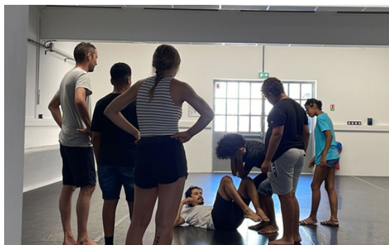
On apprend à se trainer par terre au Meltem Cirque