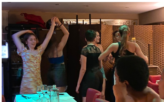
Un anniversaire spécial bazar